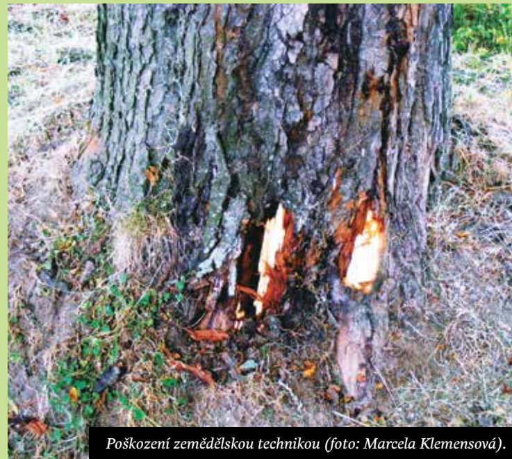
Poškození zemědělskou technikou.

Přípravek je tedy nutno aplikovat za bezvětří a vhodnými aplikátory tak, aby nedošlo k potřísnění okolní vegetace, která není určena k likvidaci. Při technologické nezádnosti nebo nesprávném poučení pracovníků, kteří postřik prováděli, dochází velice často k závažnému poškození vegetačních orgánů stromů.