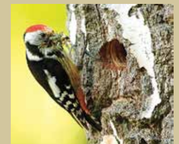
Strakapoud (foto: internet).

Aleje tvořící doprovod komunikací a ukazující cestu tak bezesporu mají velký potenciál také pro rozvoj agroturistiky. K příjemnému prožitku z pobytu v krajině aleje rozhodně přispívají. Zkušenosti z Německa hovoří o tom, že lze s alejovým putováním – alejovými cestami oslovit i autoturisty. Krajinu je možno projet autem po „alejové cestě“, přitom navštívit další přírodní a kulturní památky a zároveň využít i jiných zážitků, které poskytovatelé služeb v agroturistice na trase nabízejí.