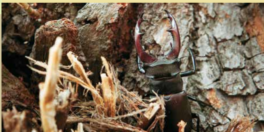
Chráněný roháč, alej podél pastviny.