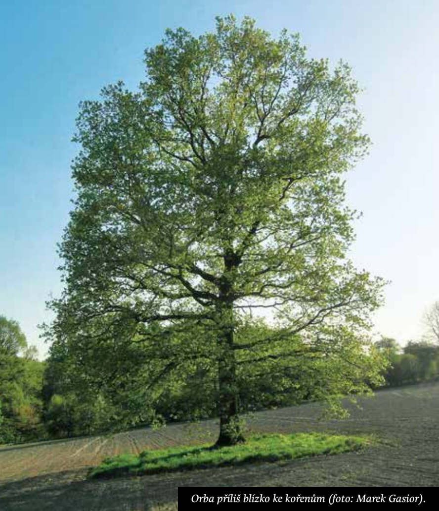
Orba příliš blízko ke kořenům.