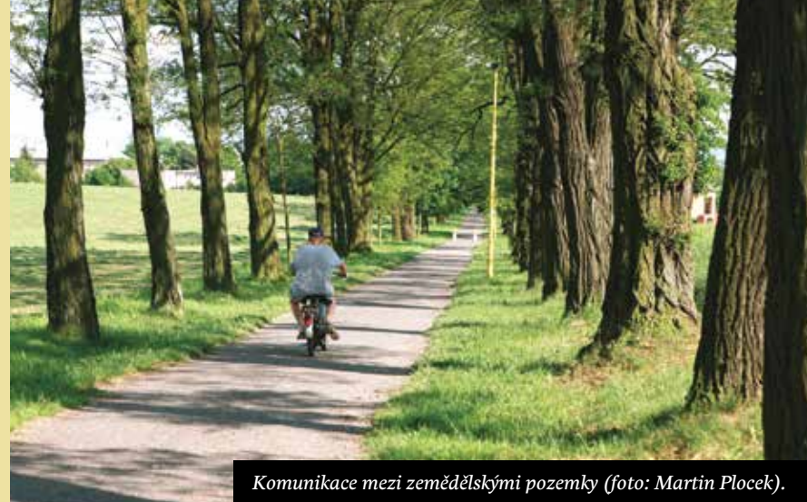
Komunikace mezi zemědělskými pozemky (foto: Martin Plocek).