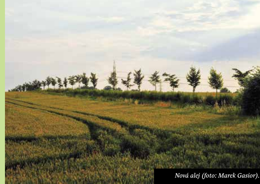
Nová alej (foto: Marek Gasior).