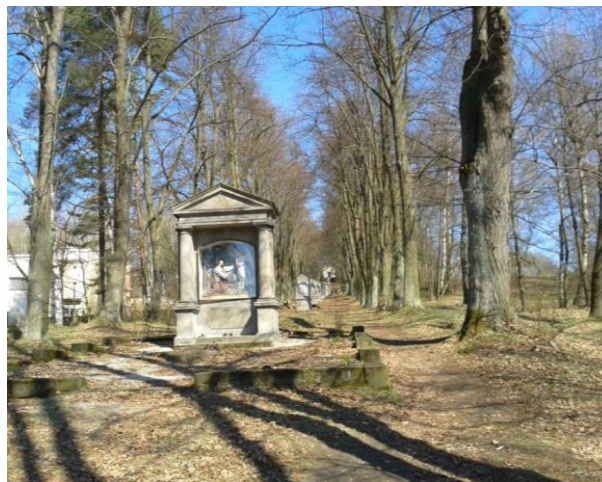
Lipová alej po ošetření (2017)

Projektová cena byla 1 625 725,- Kč (včetně DPH) a vysoutěžená a nakonec také zaplacená cena představovala 408 060,- Kč (včetně DPH).