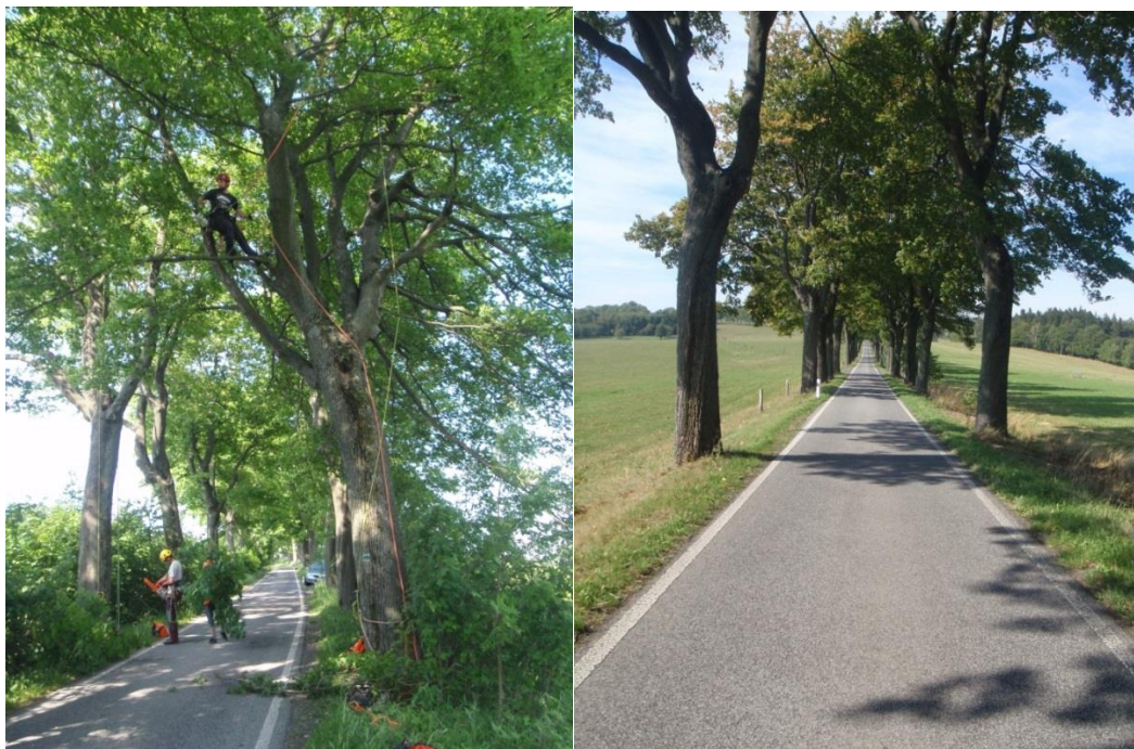
Alej Albrechtice - Vítkov v průběhu ošetření (2018)

Tato alej byla vybrána spolu s dalšími dvěma alejemi do 2. etapy ošetření významných alejí. V roce 2016 podal Liberecký kraj žádost do Operačního programu Životního prostředí na projekt „Významné aleje Libereckého kraje 2. etapa – Albrechtice - Vítkov“. Její ošetření probíhalo v roce 2018 na základě projektu, který zpracovala společnost Okrasné zahrady arboristika s.r.o., konkrétně Bc. Radovan Vosátka. Způsob ošetření stromů byl navržen tak, aby se v co největší míře zvýšila provozní bezpečnost. V rámci této akce bylo určeno k pokácení 47 z celkových 556 dřevin. Pro kácení bylo rozhodnuto především u jasanů, které byly v pokročilém stadiu infikace chalarou fraxinii. Tyto byly vykáceny i proto, aby se eliminovalo riziko přenosu houby na ostatní jedince. Ošetřeno bylo celkem 489 stromů a jednalo se především o provedení zdravotních řezů a lokální a obvodové redukce. V 35 případech byla provozní bezpečnost dřevin řešena také instalací dynamických vazeb. Za vykácené stromy byla provedena náhradní výsadba (strom za strom) a zároveň došlo k doplnění dalších výsadeb. Celkový počet nově vysázených stromů byl 95 ks. Vybrány byly javory kleny ( Acer pseudoplatanus ), které se jeví v místních podmínkách jako nejodolnější. Toto rozhodnutí vyplynulo z dendrologického posudku.