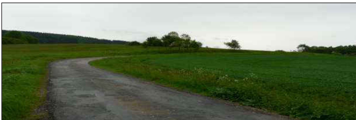
FOTO – stav před výsadbou

Bylo vysázeno 79 ks slivoní kolem málo frekventované silnice v CHKO Železné hory. Ovocné stromy tu kdysi byly, jedná se o návrat k původnímu osázení. Ponechané náletové dřeviny byly ošetřeny.